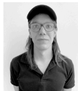
Pierre Paulin (France)

L'artista Natalie Czech (nata nel 1976, vive e lavora a Berlino) oscilla tra la poesia concreta e la fotografia concettuale. La scrittura poetica è al centro del suo lavoro, che si sforza di far emergere visivamente in molti altri media: copertine di dischi, video, lettere, giornali, annunci, etc.